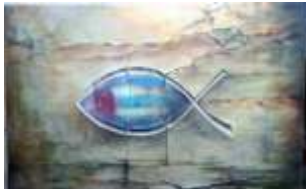
Luis Antonio Rivero Como Pez en la Roca Acrílico/Lienzo 60x40 cms